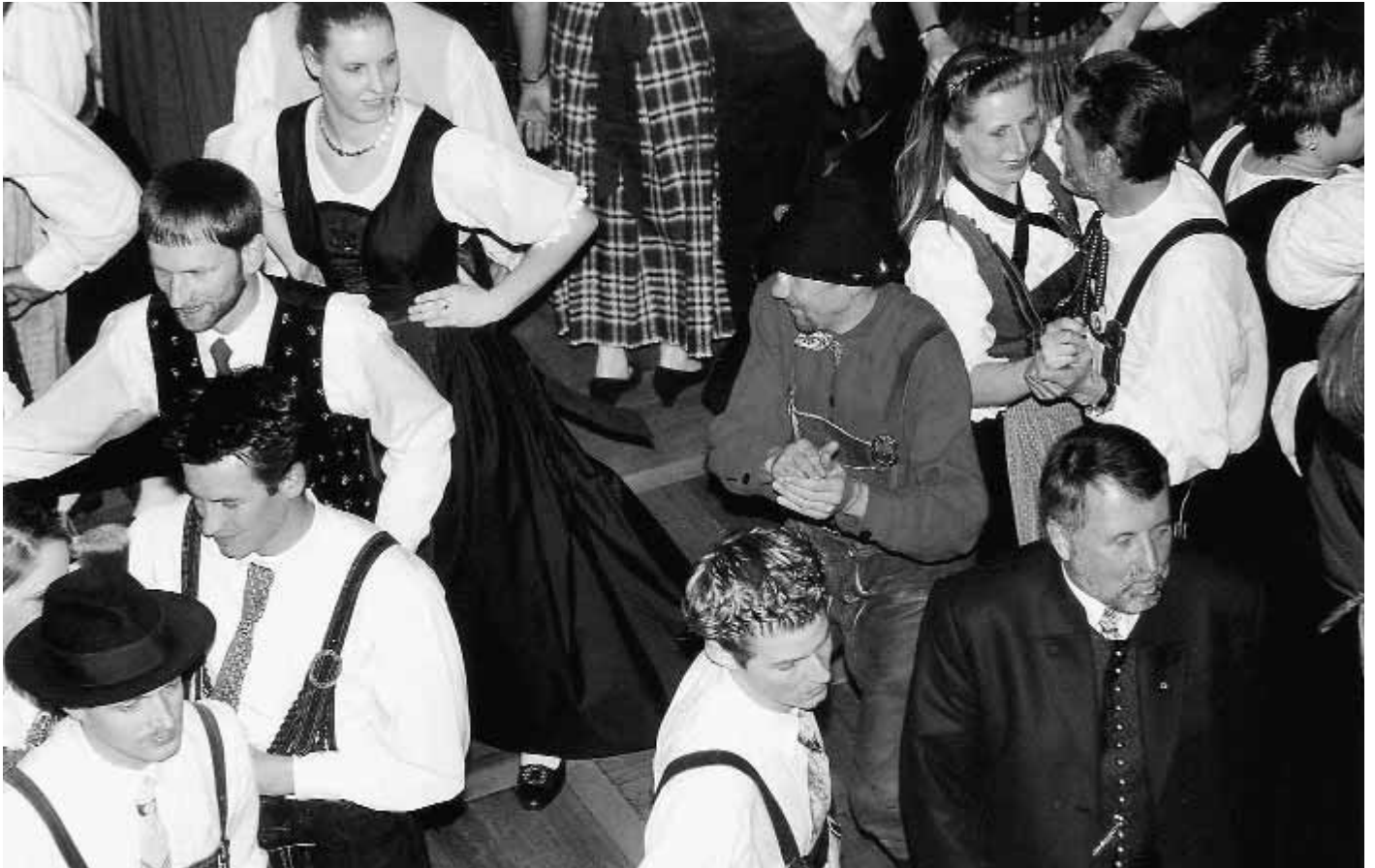
Gäste aus fast allen Bundesländern feierten mit den Kärntner Freunden