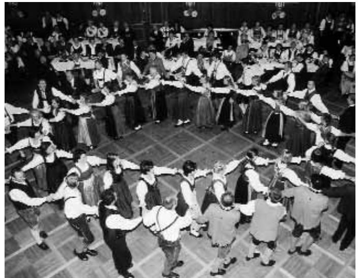
Einen Kreis mit über 30(!) Plattlern organisierte der LTH für die Pauseneinlage - ein imposantes Bild!