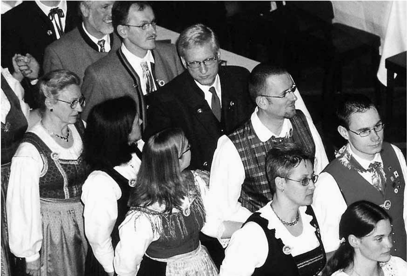
Viele bekannte Gesichter der Kärntner Tanzszene sind unter den Mitgliedern der LARGe zu finden