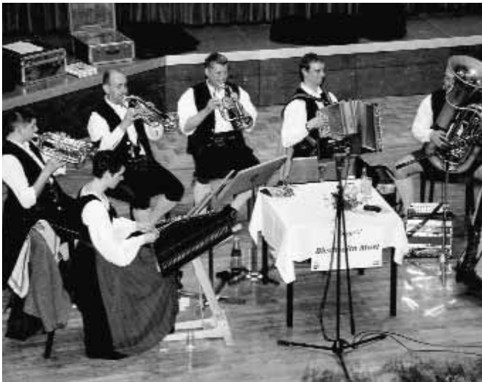
Wunderbare Tanzmusik erklang im großen Saal von der Blechsaitn Musi