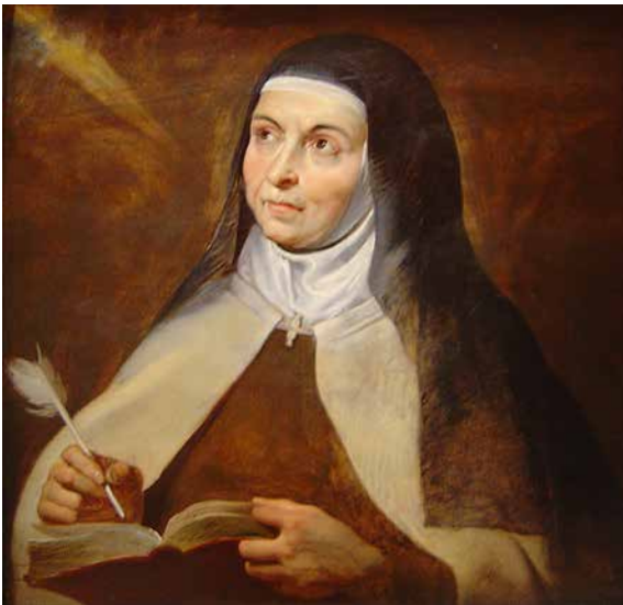
Teresa von Ávila, Peter Paul Rubens, 1615, Kunsthistorisches Museum Wien

Teresa von Ávila (1515 - 1582) war eine spanische Karmelitin, Ordensgründerin (der Unbeschuhten Karmelittinnen und Karmeliten) und Mystikerin. In der katholischen Kirche wird sie als Heilige und Kirchenlehrerin verehrt.