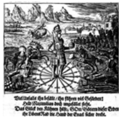
Abb. 3: Fuggers Spiegel der Ehren Erzhauses Österreich (Nürnberg 1668, Seite 1383)

Auf einem noch größeren Schwerterkreis steht Maximilian I. im »Spiegel der Ehren des Erzhauses Österreich«. Auch hier schreibt Becker »... auf der Rose des Schwerttanzen«.