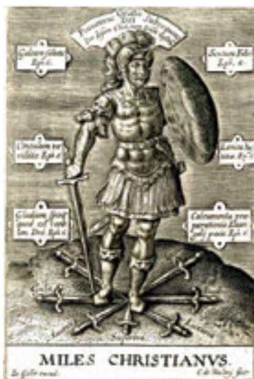
Abb. 1: vermutlich von Hieronymus Wiericx 1553–1618