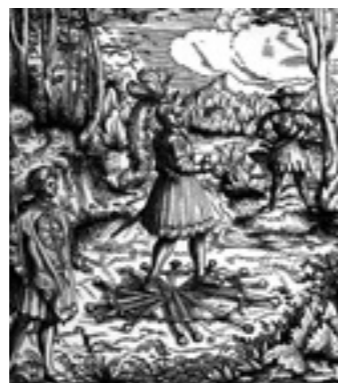
Abb. 2: Hans Schäufeleins im Theuerdank (1517/19)

des Schwerttanzen«. Im Weiteren geht der Verfasser davon aus, dass die Kupferstecher aus Antwerpen den Holzschnitt von Hans Schäufeleins (Nördlinger Werkstatt) gekannt haben müssen. Schäufeleins stellt auf seinem Holzschnitt Kaiser Maximilian I. auf »der Rose eines Schwerttanzen« dar.