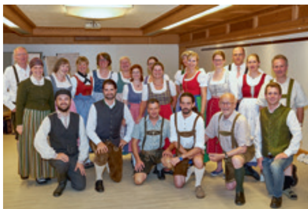
TeilnehmerInnen der BAG Woche