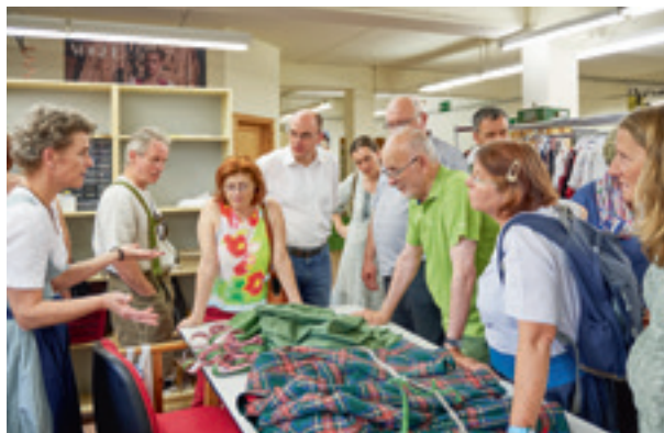
Besuch bei der Firma Tostmann in Seewalchen